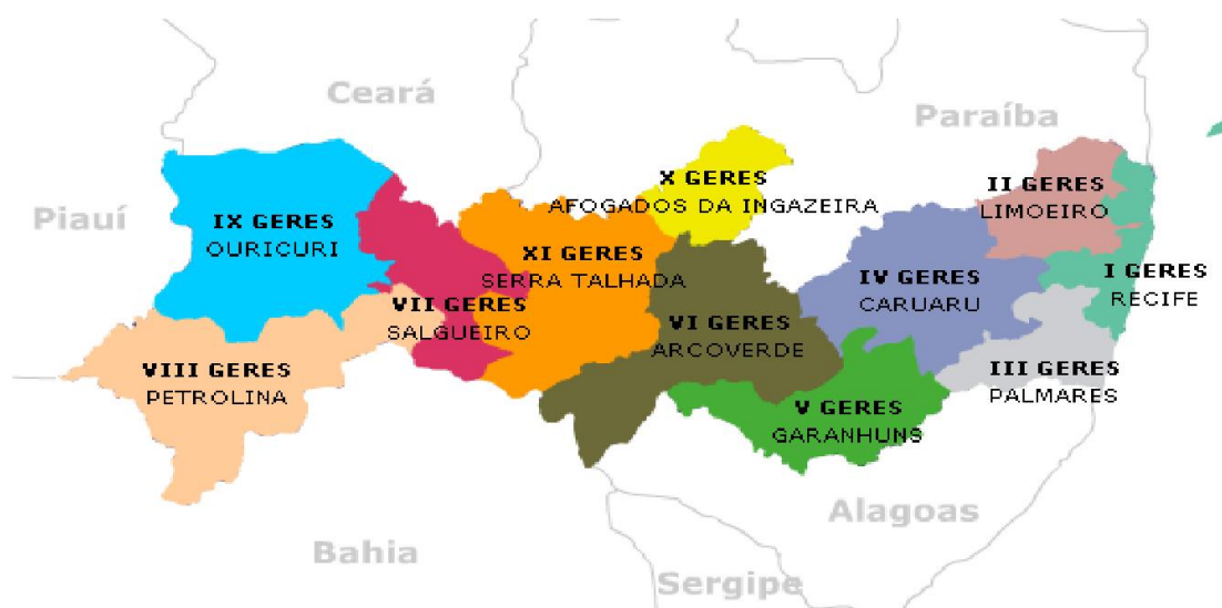
Figura 1 – Distribuição das GERES em Pernambuco.

O Município da Vitória de Santo Antão compõe a I Gerência Regional de Saúde – I Geres (Figura 1) e desempenha um papel de referência para os municípios adstritos da sua microrregião (Figura 2). A cidade tem ampliado sua infraestrutura no setor de saúde com a instalação de diversas unidades nos níveis primário, secundário e terciário, públicas e privadas. Atualmente Vitória de Santo Antão possui 27 unidades básicas de saúde atuando na Estratégia de Saúde da Família (ESF)(Figura 3) - distribuídos em quatro territórios, sendo destas 27, 03 unidades de Programa de Agentes Comunitários de Saúde (PACS) rurais, 02 unidades de telessaúde (REDENUTES), 03 equipes NASF. A cobertura da Atenção Básica no município atualmente é de 90%.